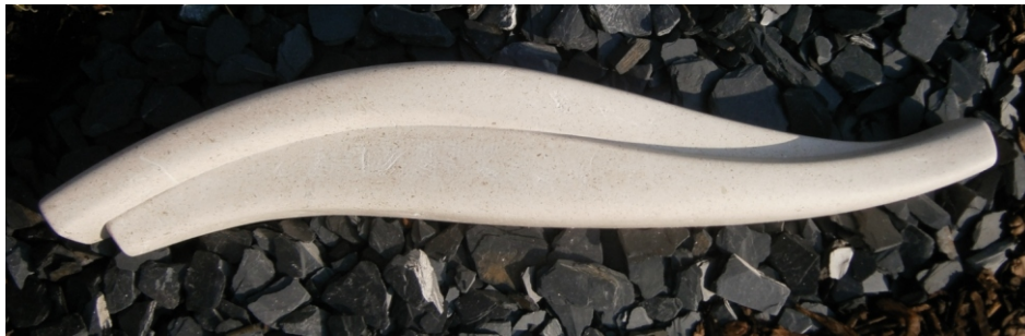
Reinhard Winter, "Hingabe, liegend", 2016, Kalkstein, L100 cm

Ort: arteum: Zentrum für Bildhauerei, Schultheßgasse 8, 1170 Wien