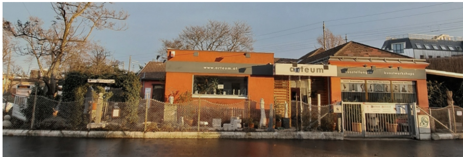
arteum: Zentrum für Bildhauerei, Schultheßgasse 8, 1170 Wien